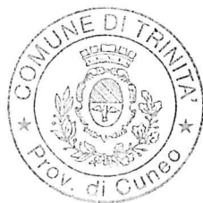
IL SINDACO Zucco Ernesta